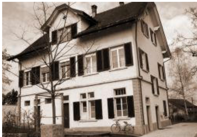
Das Purzelhaus des Elternvereins Illnau: Hier findet neu auch die Nachmittagsbetreuung der Primarschule Illnau statt.

Wo wird die Betreuung stattfinden? Im Moment planen wir, die Nachmittagsbetreuung im Purzelhaus an der Hörnlistrasse zu organisieren, zusammen mit dem Mittagstisch. Wir gehen allerdings davon aus, dass in den nächsten Jahren ein passender Anbau im Primarschulhaus Hagen realisiert wird.